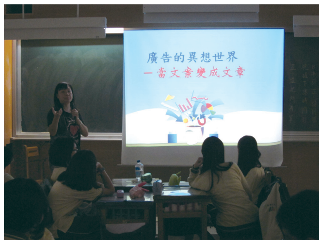
▲運用各種廣告激發孩子的創意，是淑美老師的教學法寶。